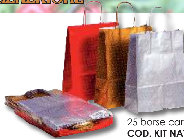
25 borse carta natale COD. KIT NATALE 22