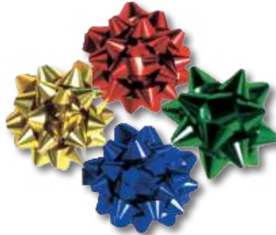
Coccardine COD. 33A