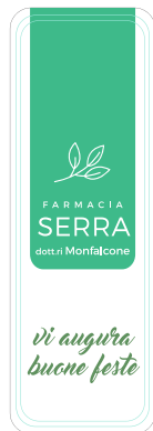
MODELLO ETICHETTA 02