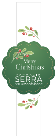
MODELLO ETICHETTA 01