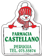
COD. N004 cm 3,5 x 4