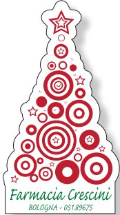
COD. N001 cm 3 x 5