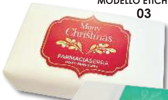
MODELLO ETICHETTA 03