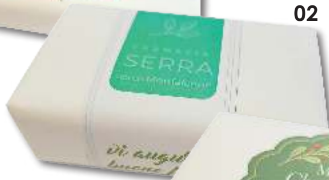
MODELLO ETICHETTA 02