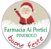
COD. N003 cm ø 3