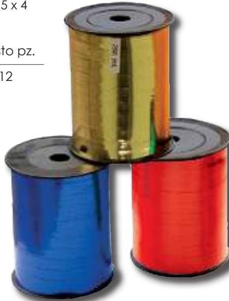
Nastro in Rotolo COD. NPPL01