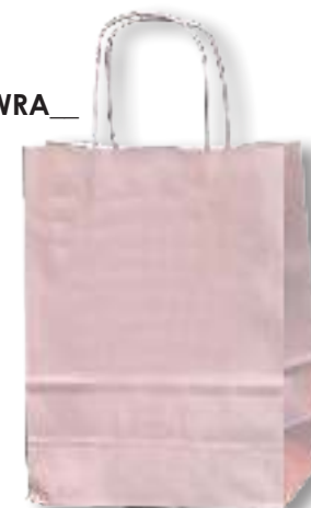
TWIST ROSA ANTICO