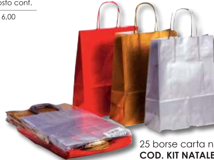
25 borse carta natale COD. KIT NATALE 36