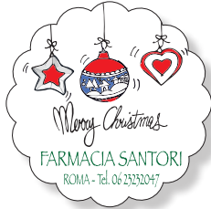
COD. N002 cm ø 4